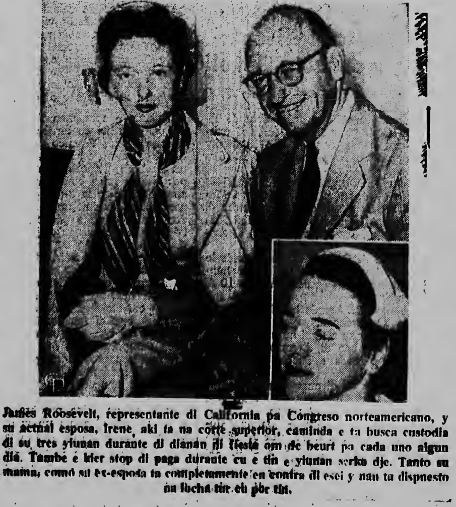
Juñes Roosevelt, representante di California pa Congreso norteamericano, y su actual esposa, Irene, aki ta na corte superior, caminda e ta busca custodia di su tres yunan durante di dianan di fiesta cu e beuri pa cada uno algun dia. Tambe e kier ser di papa durante cu e tin e yunan serka dje. Tanto su mama, como su ex-esposa ta completamente en contra di esei y nan ta dispuesto na lucha tir-e por tir-e.